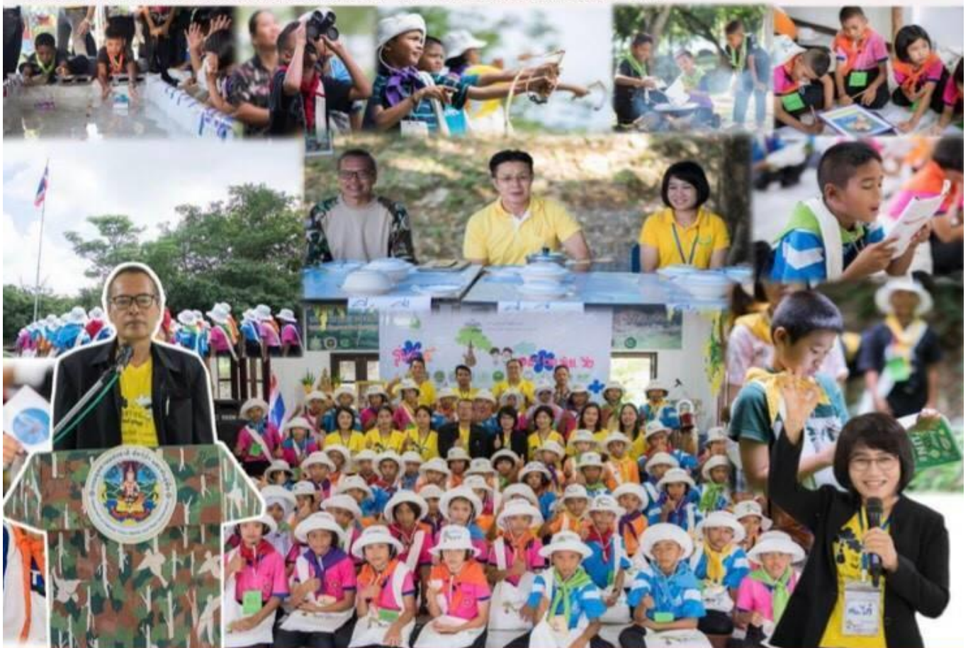
กลุ่มนิเทศ ติดตาม และประเมินผลการจัดการศึกษา สพป.นครนายก

19 -21 มิถุนายน พ.ศ. 2562 โดยมีโรงเรียนเข้าร่วม จำนวน 4 โรงเรียน ได้แก่ โรงเรียนวัดศรีจุฬา โรงเรียนวัดเกาะกา โรงเรียนบ้านดอนกลาง และโรงเรียนบ้านเตยใหญ่ รวม 60 คน จัดกิจกรรมค่าย 3 วัน 2 คืน ณ ศูนย์ศึกษาระรรมชาติและสัตว์ป่านครนายก อำเภอเมืองนครนายก จังหวัดนครนายก เน้นการบูรณาการ สหวิชาการบนพื้นฐานเรียนรู้แบบ Active Learning ผสมกับการเรียนรู้ ผ่านประสบการณ์จริง ส่งเสริมการเรียนรู้โดยตรงจากแหล่งศึกษาธรรมชาติในท้องถิ่น เพื่อปลูกจิตสำนึกด้านการอนุรักษ์ทรัพยากรธรรมชาติและสิ่งแวดล้อมให้แก่เยาวชน โดยท่าน พิเชษฐ์ นนท์พละ ผู้อำนวยการสำนักงานเขตพื้นที่การประถมศึกษาานครนายก มาตรวจเยี่ยมค่ายและให้กำลังใจนักเรียนและคณะวิทยากรในการทำกิจกรรม # "ค่ายเยาวชน...รักษ์พงไพร" ปีที่ 5